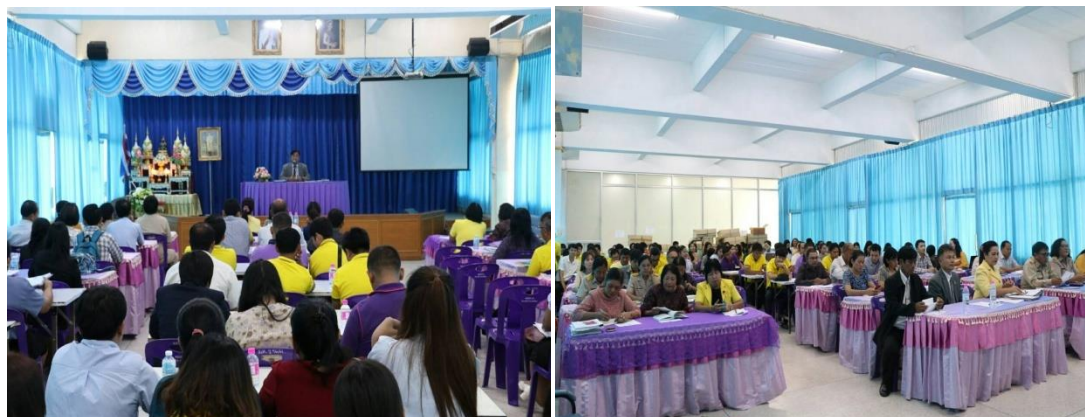
ภาพที่ 18 การประชุมผู้เกี่ยวข้องเพื่อวางแผนกำหนดแนวทางการดำเนินการทดลองใช้คู่มือการป้องกันและแก้ไขปัญหายาเสพติด โดยใช้กระบวนการบริหารคุณภาพ

จากภาพที่ 18 การประชุมผู้เกี่ยวข้องเพื่อวางแผน และชี้แจงแนวทางการดำเนินการทดลองใช้คู่มือการป้องกันและแก้ไขปัญหายาเสพติด โดยใช้กระบวนการบริหารคุณภาพ มีดังนี้