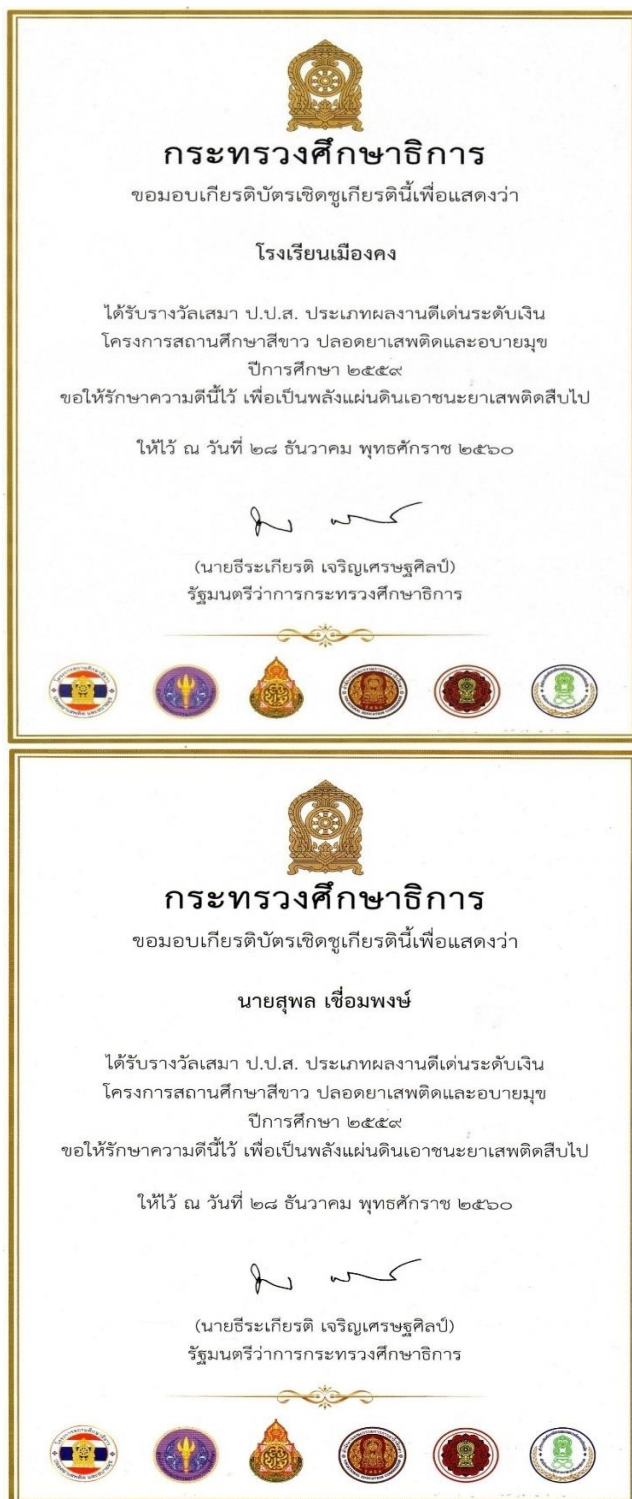
ภาพที่ 19 ภาพเกียรติบัตรรางวัลเสมา ป.ส. โครงการสถานศึกษาสีขาวปลอดยาเสพติดและอบายมุข ประจำปีการศึกษา 2559 จากกระทรวงศึกษาธิการ