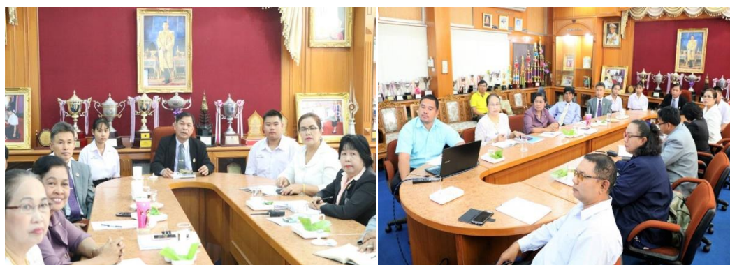
ภาพที่ 15 การประชุมวางแผนจัดทำโครงการป้องกันและแก้ไขปัญหายาเสพติด โดยใช้กระบวนการบริหารคุณภาพ

จากภาพที่ 15 การดำเนินการประชุมผู้เกี่ยวข้อง เพื่อจัดทำโครงการป้องกันและแก้ไขปัญหายาเสพติด โดยใช้กระบวนการบริหารคุณภาพ และการวางแผนประเมินโครงการ ซึ่งผลการประชุมพบว่า การดำเนินงานตามโครงการป้องกันและแก้ไขปัญหายาเสพติด โดยใช้กระบวนการบริหารคุณภาพ ประกอบด้วย 1) การวางแผน (Plan) 2) การดำเนินการ (Do) 3) การตรวจสอบ (Check) และ 4) การสะท้อนผล (Action) มีกิจกรรมในการดำเนินการป้องกันและแก้ไขยาเสพติด จำนวน 10 กิจกรรม ประกอบด้วย 1) กิจกรรมรณรงค์ต่อต้านยาเสพติด 2) กิจกรรม TO BE NUMBER ONE 3) การเชิญวิทยากรมาให้ความรู้เรื่องยาเสพติด 4) กิจกรรมการเยี่ยมบ้าน 5) กิจกรรมส่งเสริมและพัฒนาศักยภาพทางวิชาการ 6) กิจกรรมส่งเสริมความสามารถด้านศิลปะ ดนตรี กีฬา 7) กิจกรรมค่ายปฏิบัติธรรม 8) กิจกรรมสภานักเรียน 9) กิจกรรมจิตอาสาบำเพ็ญตนเพื่อสาธารณประโยชน์ 10) กิจกรรมค่ายปรับเปลี่ยนพฤติกรรม มีการประเมินผลโครงการ โดยใช้รูปแบบการประเมิน CIPP Model ของ Stufflebeam (1971) ที่ประกอบด้วย 1) การประเมินบริบท (Context Evaluation) 2) การประเมินปัจจัยเบื้องต้น (Input Evaluation) 3) การประเมินกระบวนการดำเนินงาน (Process Evaluation)