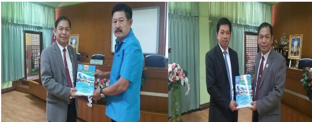
ภาพที่ 20 การเผยแพร่คู่มือโครงการป้องกันและแก้ไขปัญหายาเสพติด โดยใช้กระบวนการบริหารงานคุณภาพ