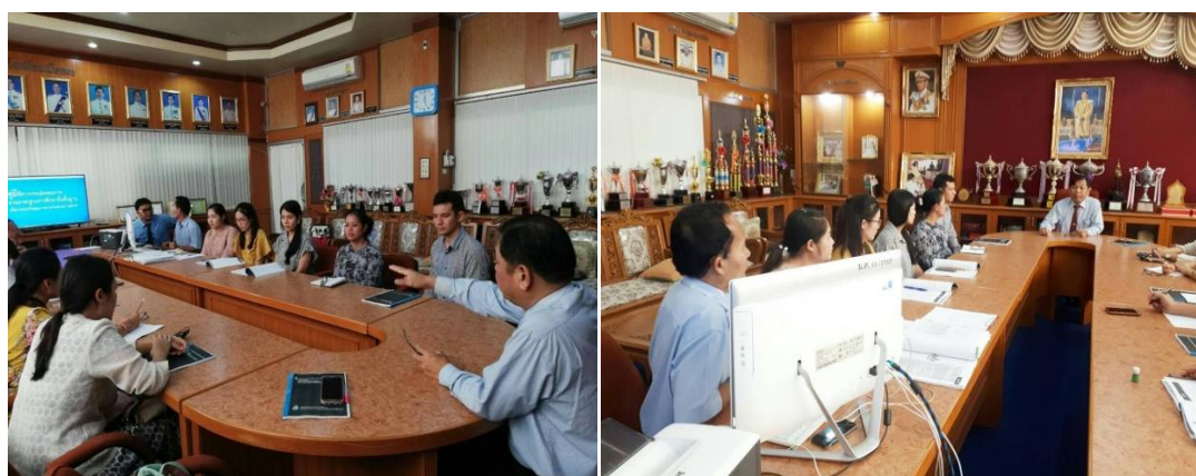
ภาพที่ 17 การประชุมของผู้เกี่ยวข้องเพื่อดำเนินการพัฒนาคู่มือโครงการป้องกันและแก้ไขปัญหายาเสพติด โดยใช้กระบวนการบริหารคุณภาพ

จากภาพที่ 17 การประชุมผู้เกี่ยวข้อง ในการพัฒนาคู่มือโครงการป้องกันและแก้ไขปัญหายาเสพติด โดยใช้กระบวนการบริหารคุณภาพ ผลการพัฒนาคู่มือมีรายละเอียดการนำเสนอ ดังนี้